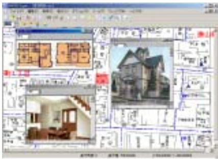
画像はイメージです。実際とは異なる場合があります。

不動産における賃貸物件の管理を、住宅地図をベースに視覚的にかつ、効率良く管理します。データベース、住宅地図、双方からの物件の検索が可能で、住宅地図上の特定物件をクリックするだけでその物件の詳細情報も表示できます。関連ファイルとリンクさせることも可能であるため、地図上の特定物件に関連する写真画像や見取り図などを、クリックひとつで表示させることができます。 “MAPIN”の機能を使えば、賃貸物件をパソコンの画面上で一元管理することができるので、管理台帳と住宅地図を別々に照らし合わせる必要も無く、物件の管理効率の向上につながります。